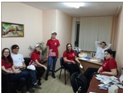
Обучающие мероприятия Комплексные обучающие мероприятия в общежитиях включали в себя тренинги и экспресс тестирование на ВИЧ

Мероприятие: Проведение акций экспресс-тестирования на ВИЧ