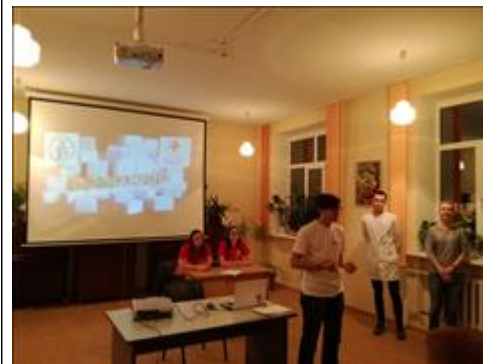
Обучающее мероприятие в общежитии Были проведены комплексные мероприятия по пропаганде ЗОЖ, включающие тренинги по технологии "равный - равному" и экспресс тестирование