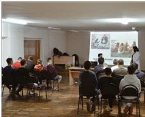
Обучающее мероприятие в общежитии Была проведена серия тренингов в общежитиях города Самары (Общежитие колледжа строительства и предпринимательства )