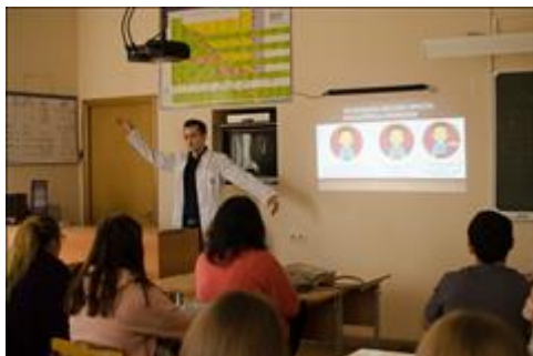
Кулинарный Техникус Волонтеры Фонда провели серию тренингов по пропаганде ЗОЖ по технологии "равный - равному"