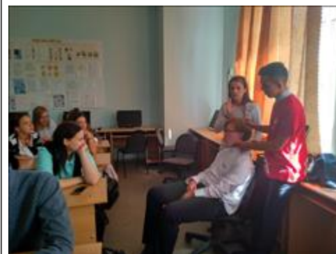
Волонтеры- тренеры В школе 9 в г. Чапаевске специалист и волонтеры Фонда совместно с волонтерами-медиками провели серию тренингов по теме "Личная безопасность"

Мероприятие: Проведено 5 мероприятий обучающих мероприятий в общежитиях, летних лагерях, интернатах, охвачено 60 человек