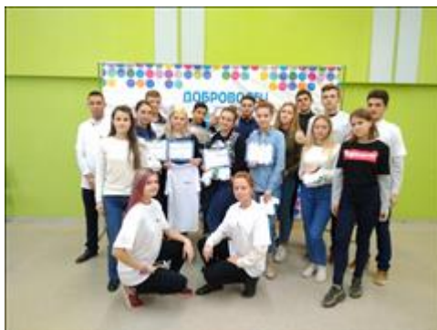
Конференция. Чапаевск Волонтеры прошедшие обучение по технологии "равный-равному" получили сертификаты и промопродукцию