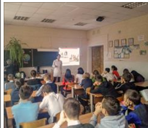
Волонтеры тренеры Волонтеры Фонда провели серию тренингов среди учащихся школ Самары