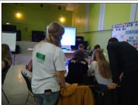
Конференция. Чапаевск. Мастер-класс по работе с молодежью по технологии "равный равному"