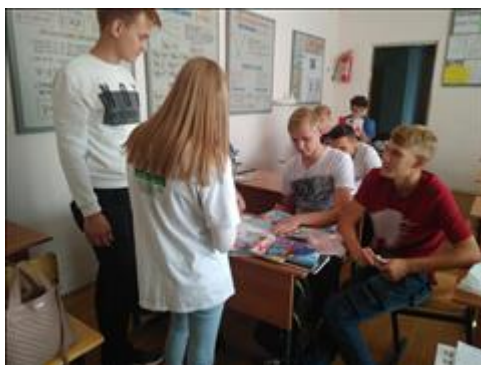
Тренинг "Равный равному" Волонтеры Фонда провели тренинг по технологии "Равный равному" по пропаганде ЗОЖ среди студентов Чапаевского Государственного Колледжа