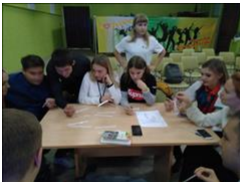
Конференция. Чапаевск Обучение волонтеров технологии "равный-равному"

Количество публикаций за весь срок осуществления проекта