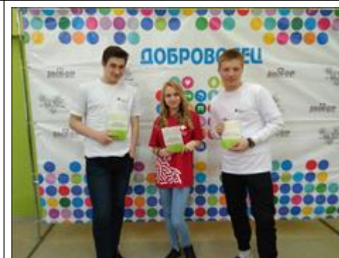
Конференция. Чапвевск Волонтеры Фонда и волонтеры медики Чапаевска приняли активное участие в мероприятии